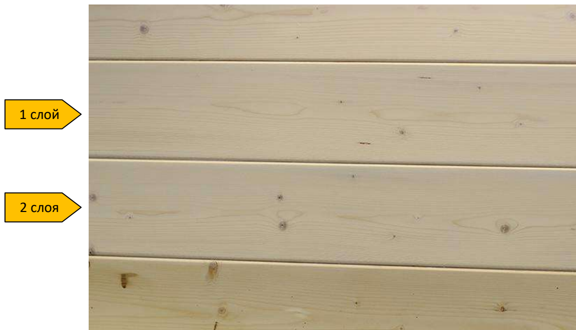
образцы с однослойным и двухслойным нанесением Terra Wax-Oil

Adler Terra Wax-Oil (арт. 703600020002) можно применять в системе с Lignovit Primo (арт 535800020004). Оттенки Adler Terra Wax-Oil см.на сайте www.adler-lacke.ru